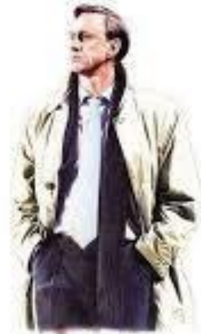
JOHAN CRUYFF THE LEGEND

voetbal doe je met je hoofd. De bal gaat nu eenmaal sneller dan je benen.